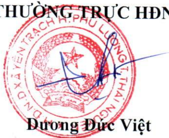
Dương Đức Việt